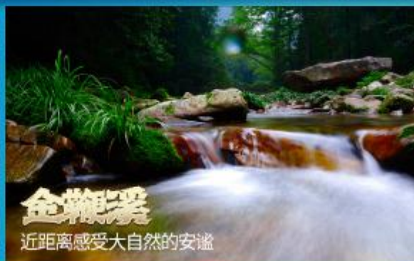
金鞭溪 近距离感受大自然的静谧