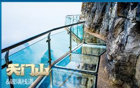
天门山 & 玻璃栈道

World Cultural Heritage, 5A level scenic area Location of Avatar Three thousand strange peaks and eight hundred beautiful waters Take the Bailong elevator to Yunding in 66 seconds Classic tour of World Lakes - Baofeng Lake This natural beauty amazes you!