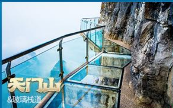
天门山 & 玻璃栈道

World Cultural Heritage, 5A level scenic area Location of Avatar Three thousand strange peaks and eight hundred beautiful waters Take the Bailong elevator to Yunding in 66 seconds Classic tour of World Lakes - Baofeng Lake This natural beauty amazes you!