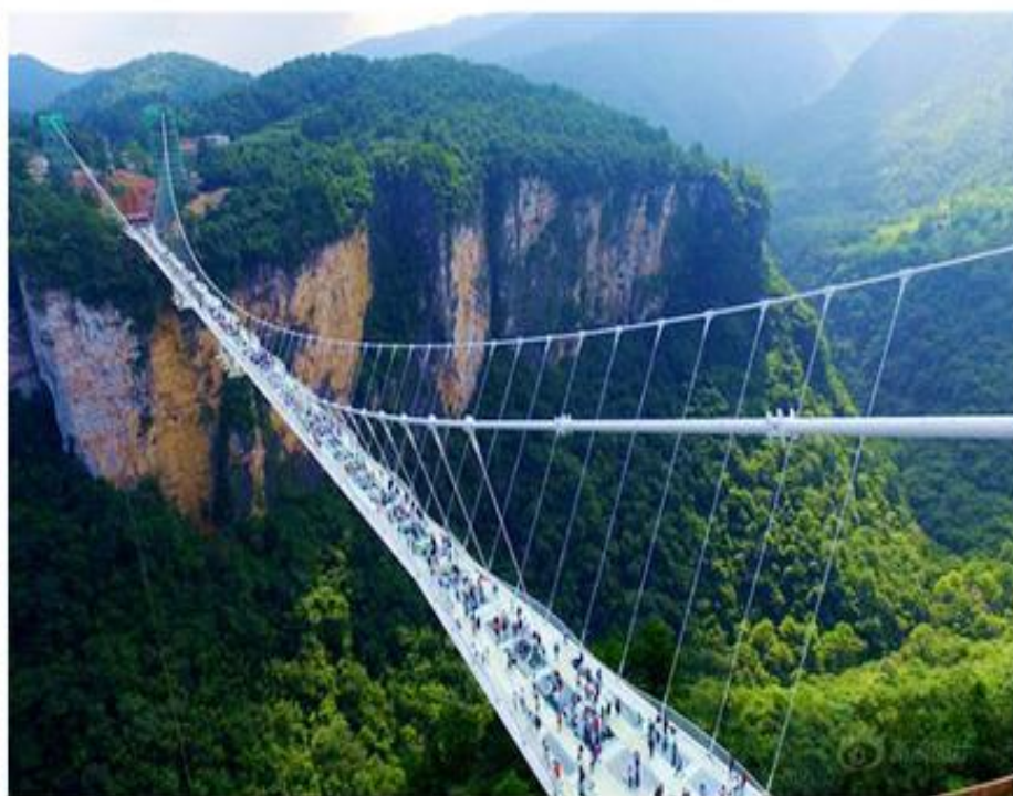
世界第一玻璃桥—云天渡