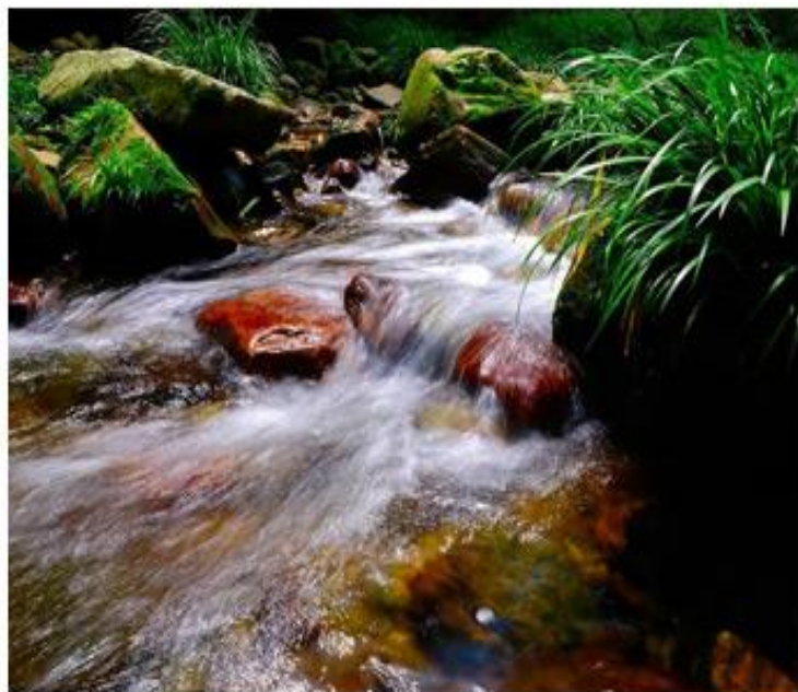
金鞭溪风景区精华段