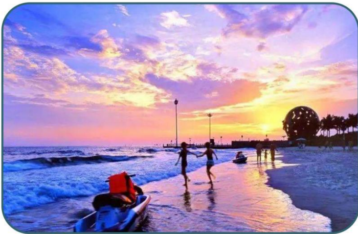
北海银滩 | 天下第一滩