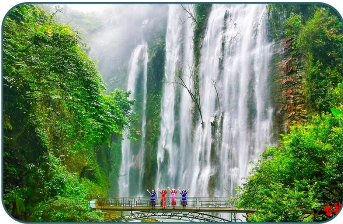
古龙山 | 四峡三洞世界级奇观