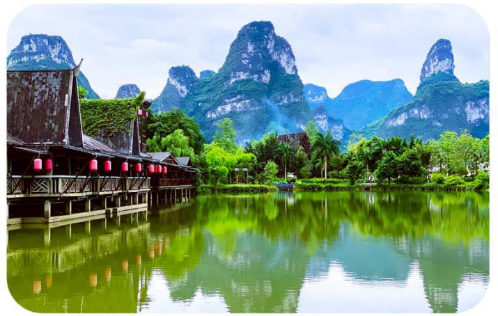
明仕田园 | 多部电视剧拍摄取景地