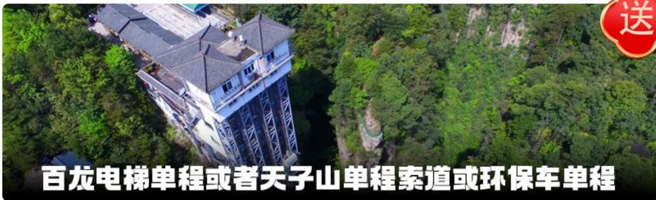
百龙电梯单程或者天子山单程索道或环保车单程