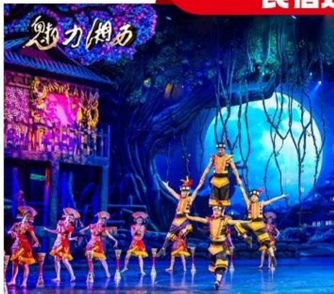
魅力湘西 冯小刚导演顶级本土民俗大戏