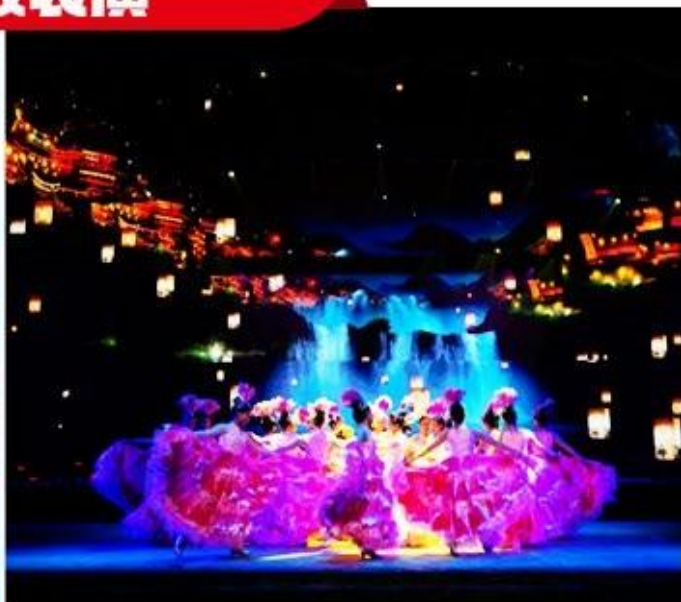
花开芙蓉 毕兹卡的狂欢之夜