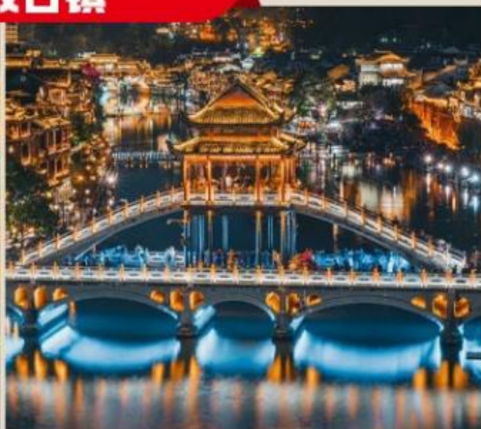
凤凰古城+芙蓉镇·打卡双古镇双夜景，惬意时光，慵懒小镇.....