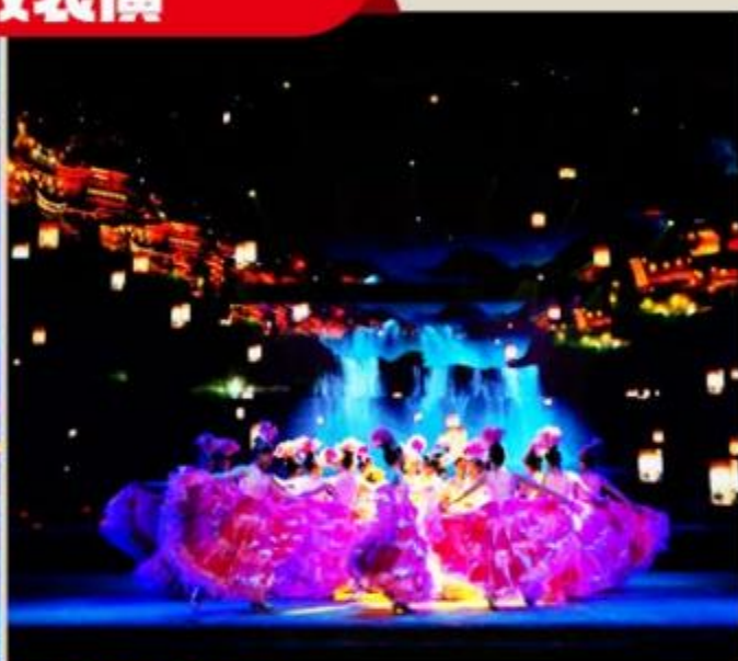
魅力湘西 冯小刚导演顶级本土民俗大戏