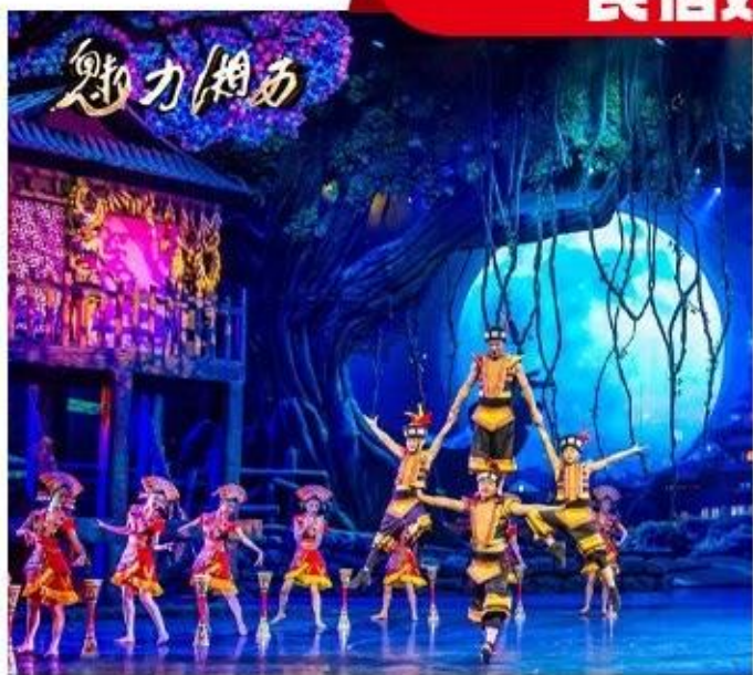
魅力湘西 冯小刚导演顶级本土民俗大戏