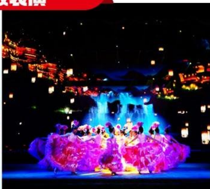
花开芙蓉 毕兹卡的狂欢之夜