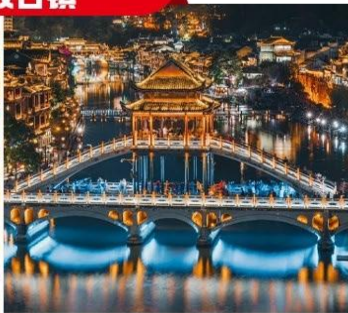
凤凰古城+芙蓉镇·打卡双古镇双夜景，惬意时光，慵懒小镇.....