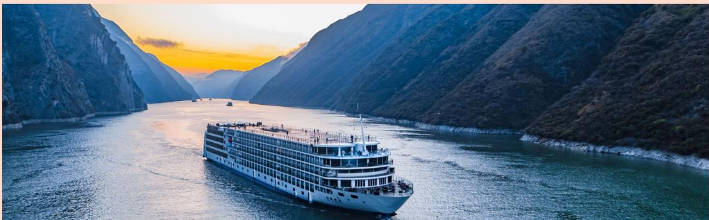
(四星) 豪华游轮 游览举世闻名的国家AAAAA【长江三峡】