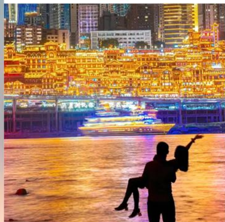
洪崖洞 国家AAAA级旅游景区