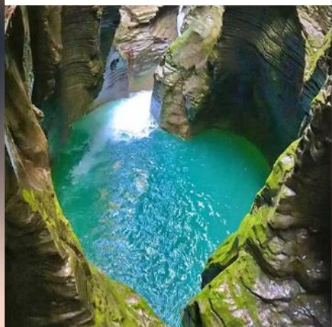
恩施地心谷 国家AAAA级旅游景区