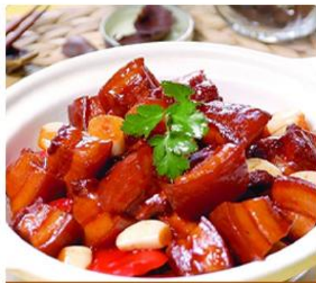
主席宴或者常德湖鱼宴