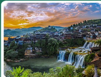
网红打卡凤凰古城