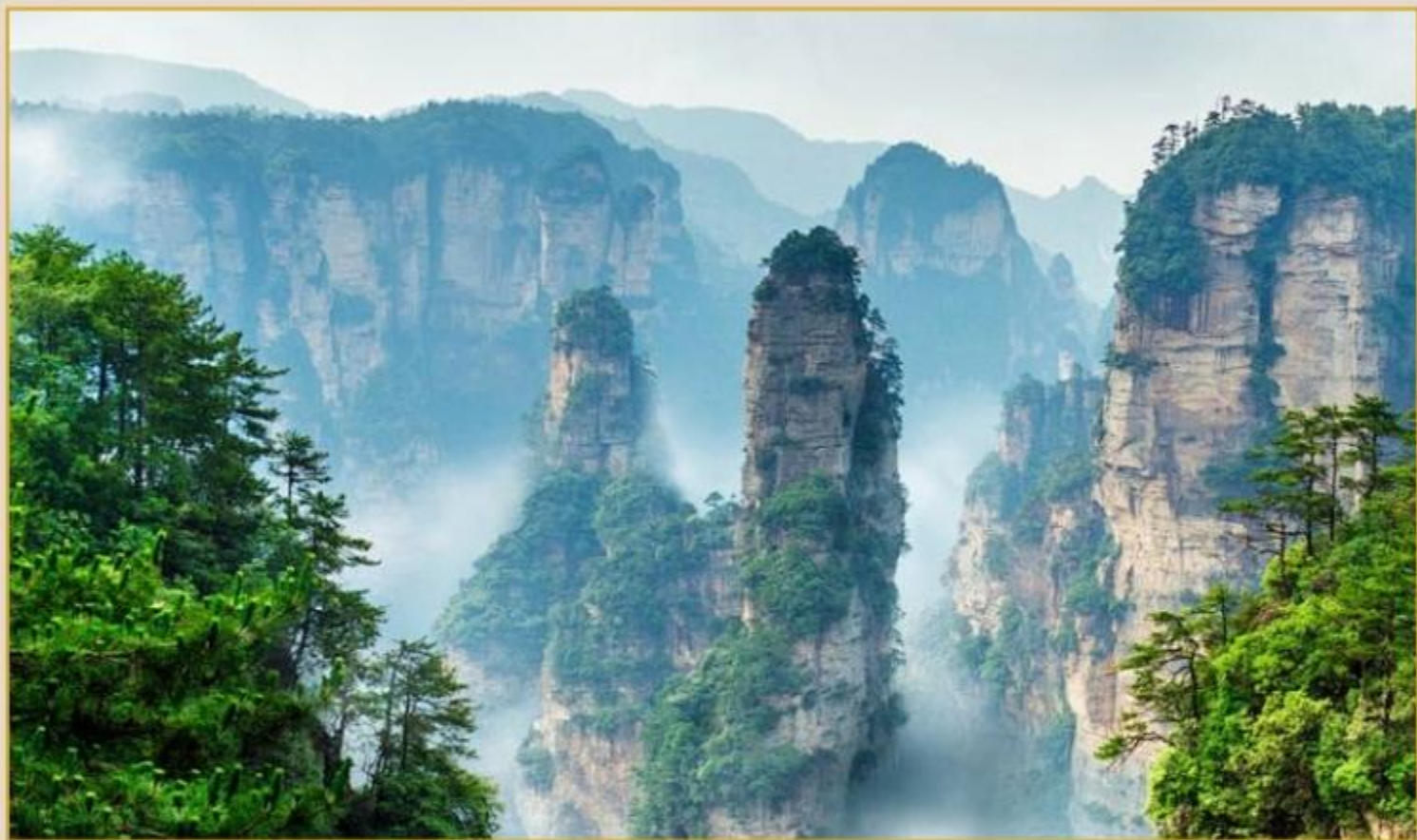
张家界国家森林公园

>Lorem ipsum & sit vlt amet, consetetuer veli de longi vlt, sed de chammod tempus facit debent ut laborat et dolere magna aliqua. Quis ipsum suscipit lino ultrices gravida. Eius commocho viverra