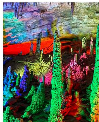
凤凰古城 + 芙蓉镇 + 黄龙洞