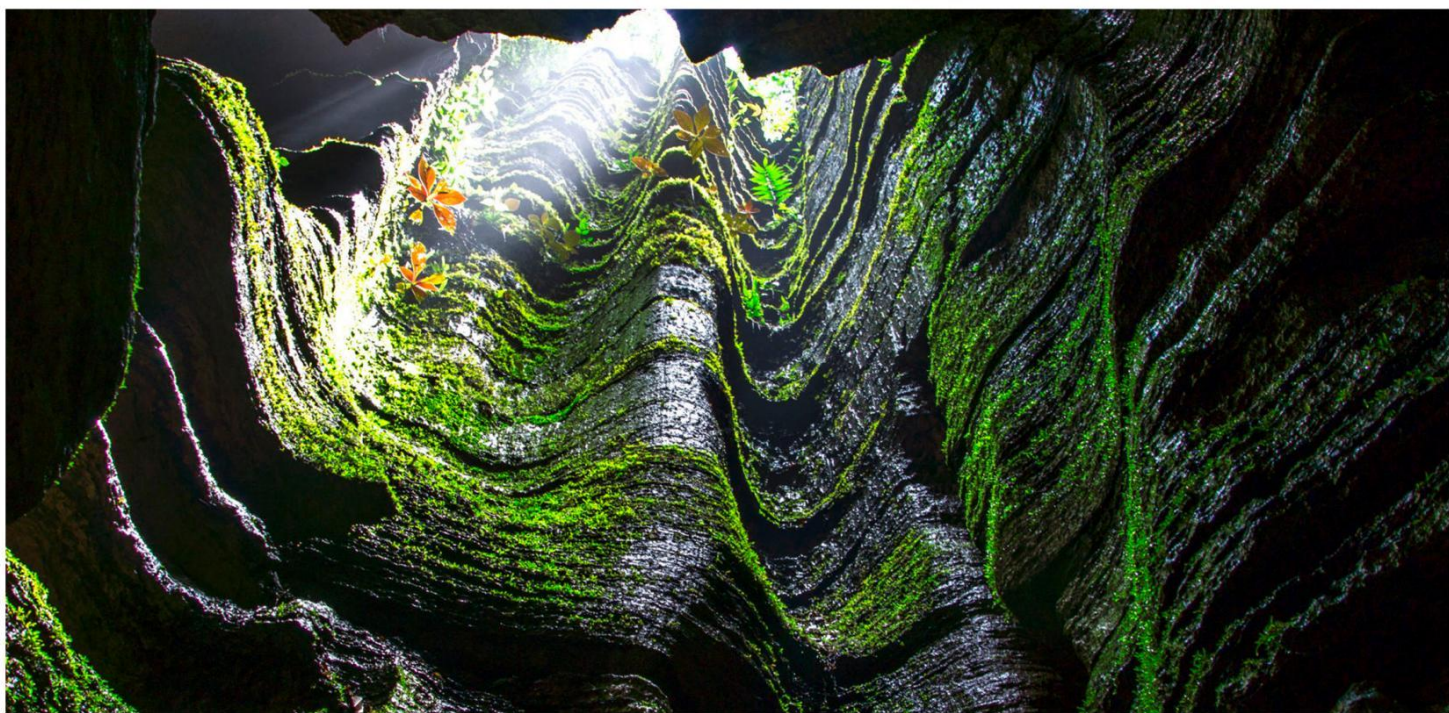
4.6亿年前的奥陶纪石林-梭布垭石林

Essential scenic spot Internet celebrity Enshi