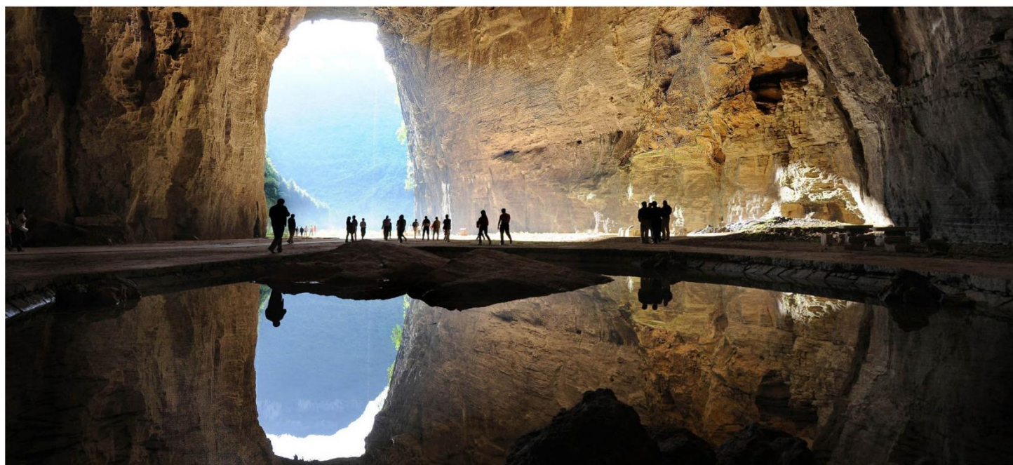
“中国地质博物馆” 腾龙洞

Essential scenic spot Internet celebrity Enshi