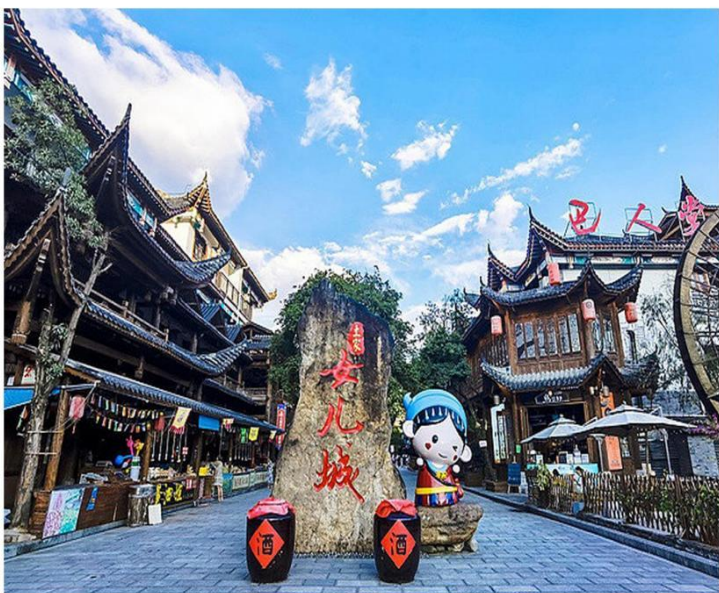
天下女儿不二心-女儿城