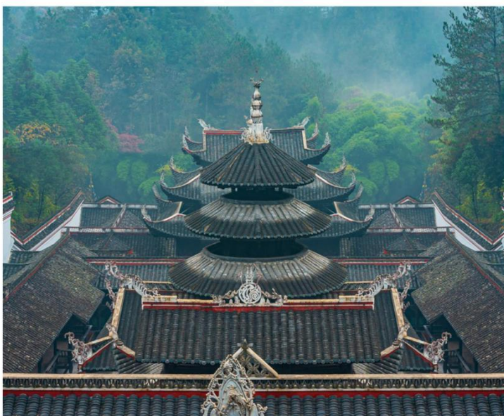
“天下无双景，华中第一城” 【恩施土司城】