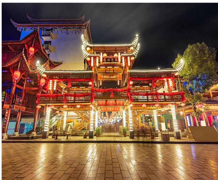
天下女儿不二心 【女儿城】