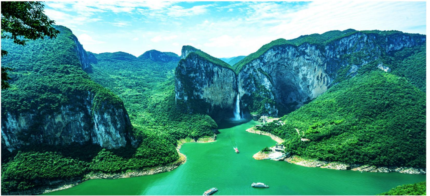
八百里清江画廊-土家母亲河【大清江蝴蝶岩风景区】

Essential scenic spot Internet celebrity Enshi