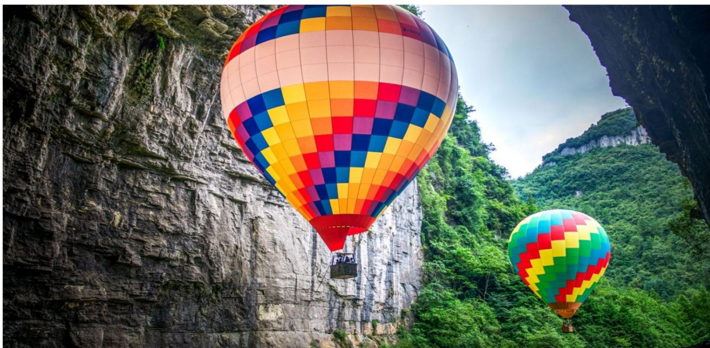
中国最美丽的地方，亚洲最大溶洞【腾龙洞】

Essential scenic spot Internet celebrity Enshi