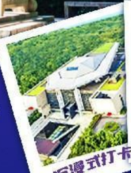
沉浸式打卡网红长沙