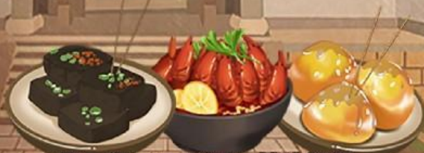
臭豆腐 口味虾 糖油粑粑