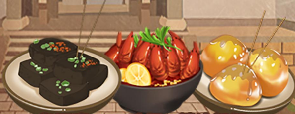
臭豆腐 口味虾 糖油粑粑

尊享 | 百年老店-坡子街【火宫殿总店】 赠送 | 火宫殿全店通用九折券、品牌矿泉水