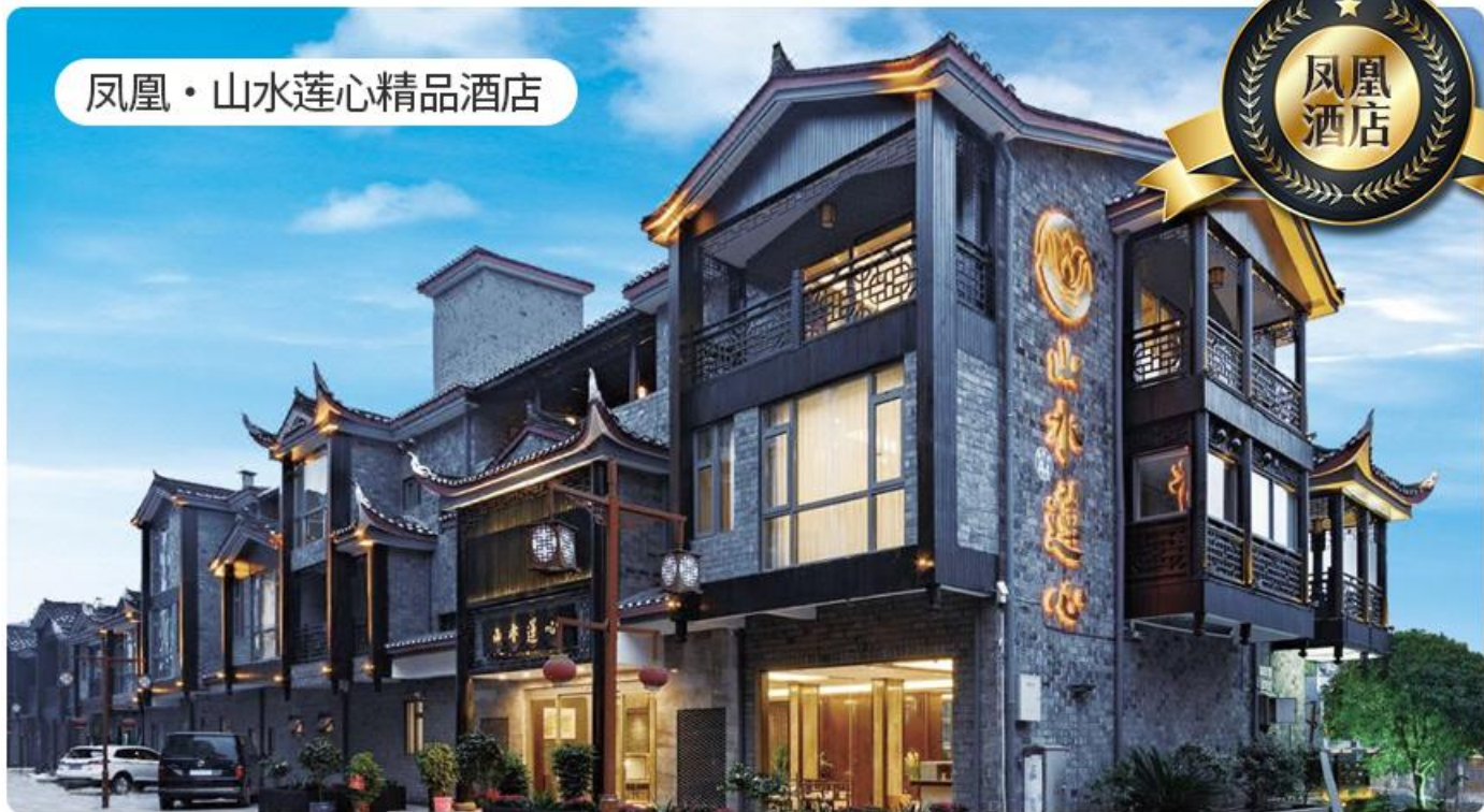
凤凰·山水莲心精品酒店