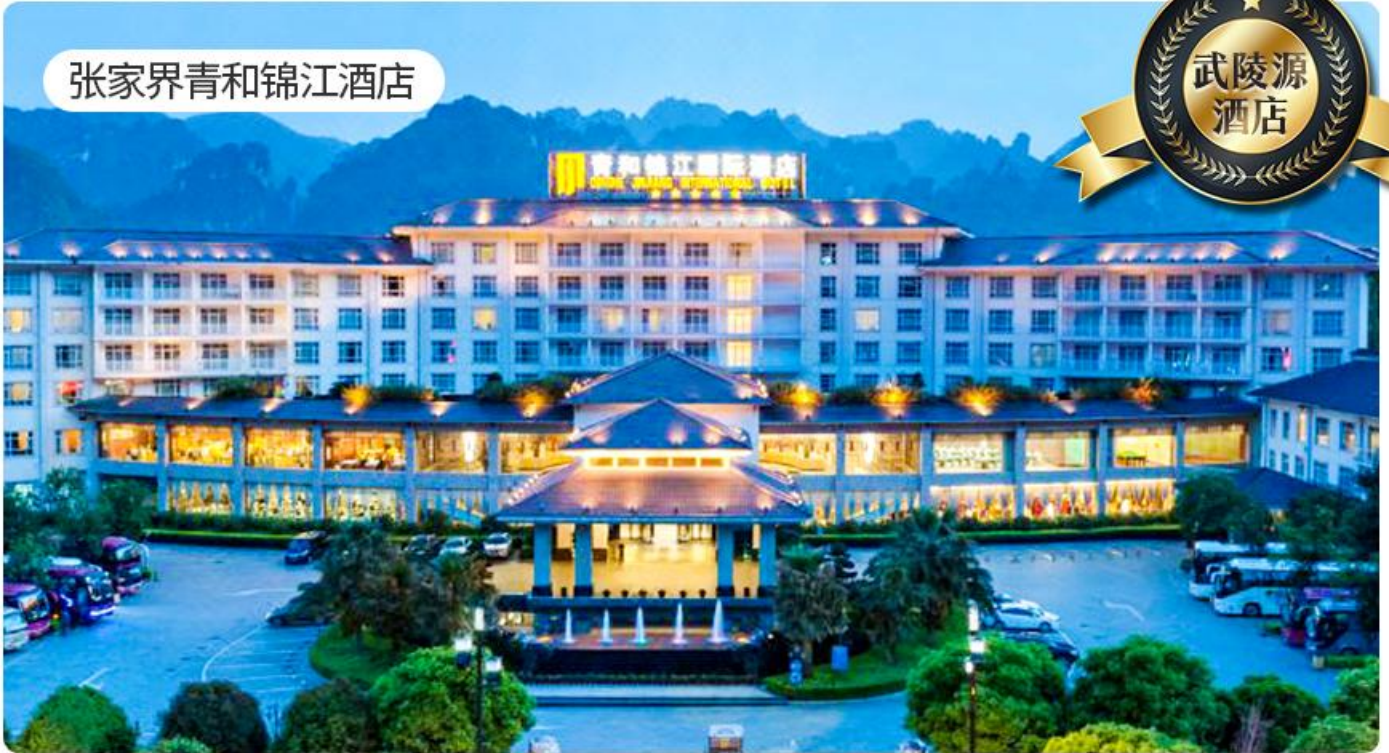
张家界青和锦江酒店