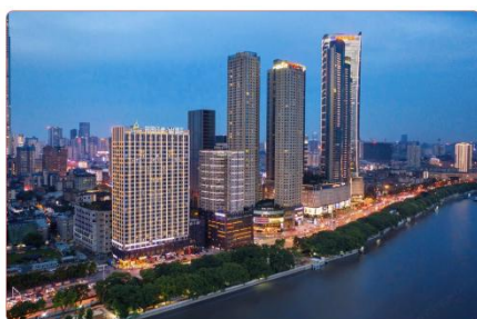
异国印象酒店（国金店）