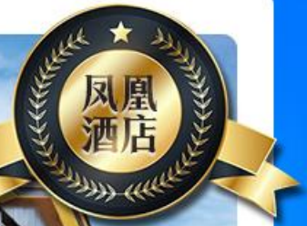
凤凰·山水莲心精品酒店