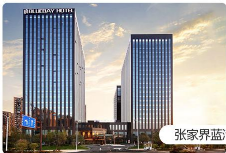
张家界蓝湾博格酒店