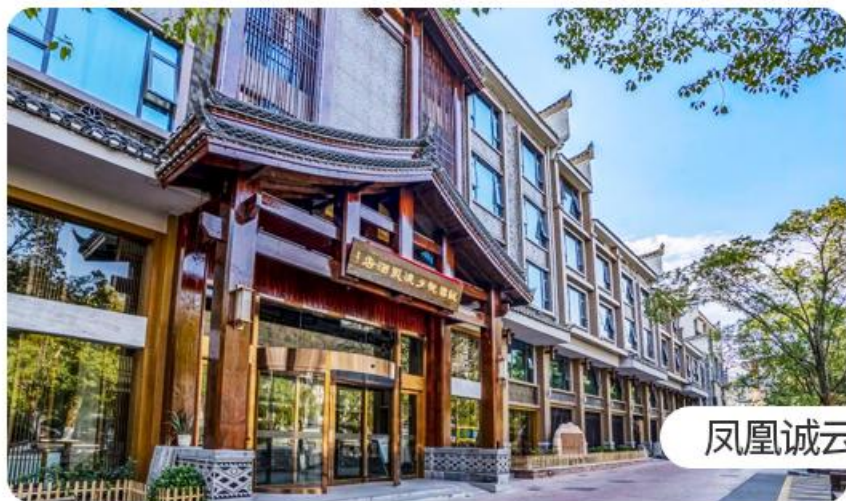
凤凰诚云悦夕酒店