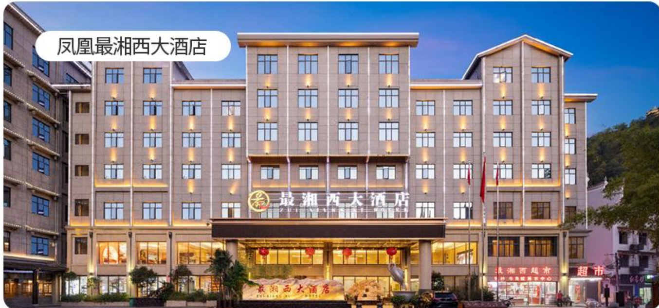
凤凰最湘西大酒店