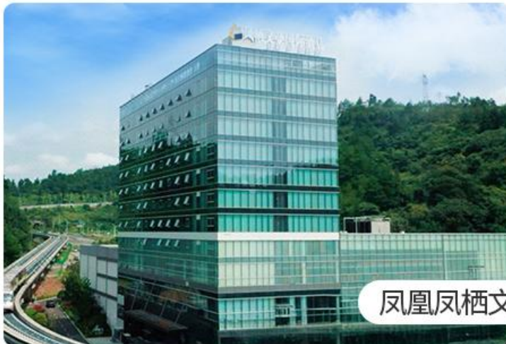
凤凰凤栖文豪国际酒店