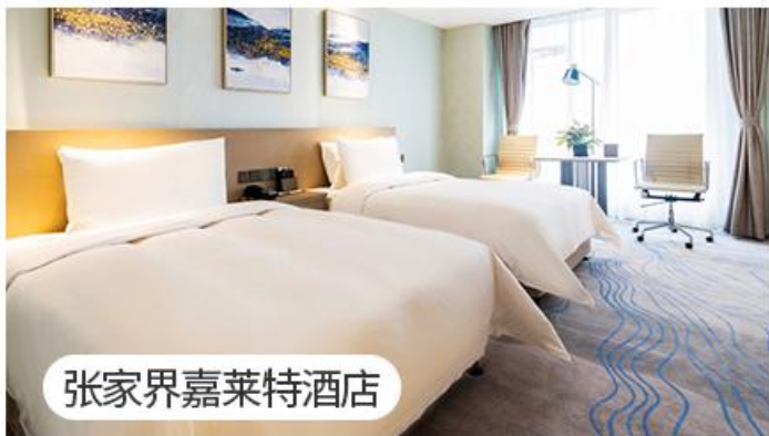
张家界嘉莱特酒店