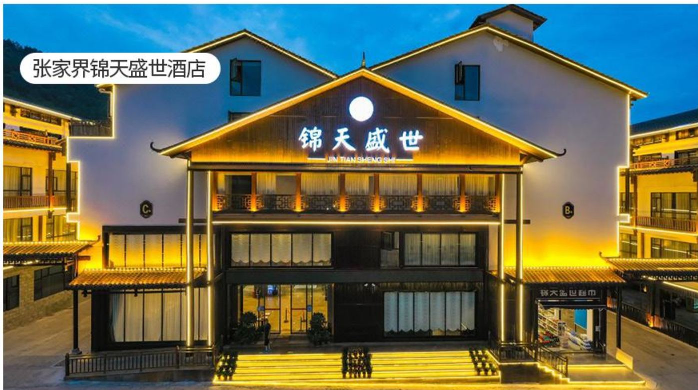
张家界锦天盛世酒店