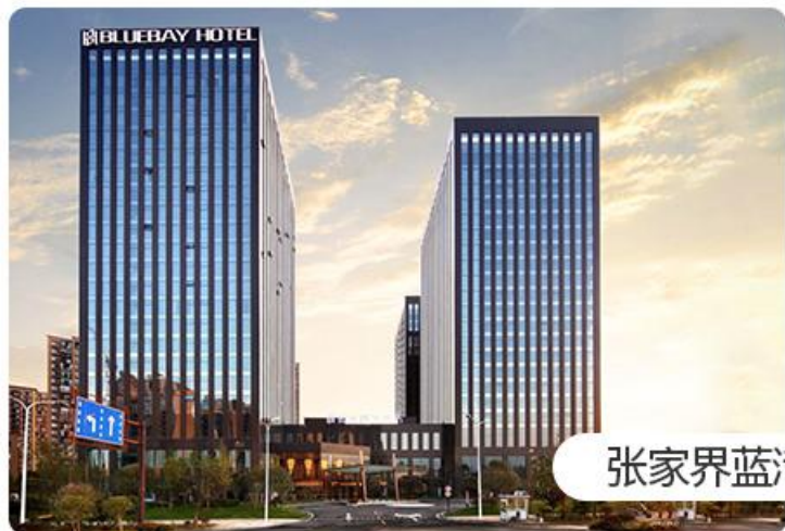
张家界蓝湾博格酒店