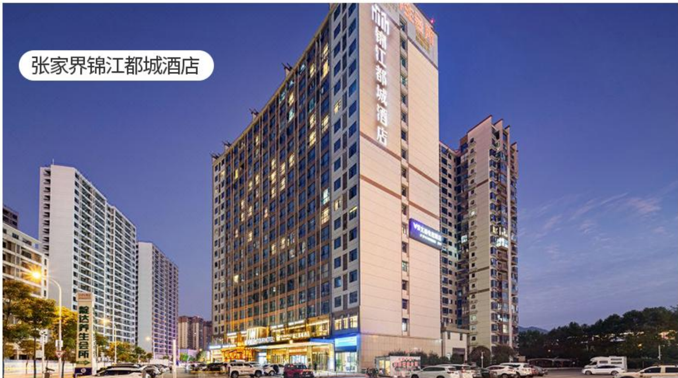
张家界锦江都城酒店