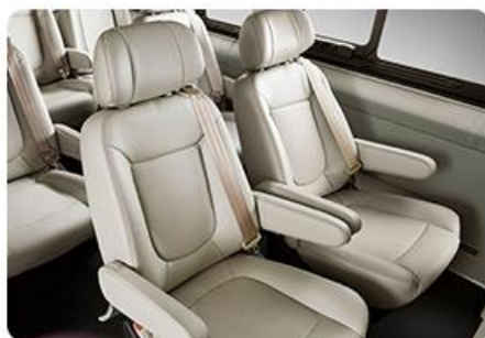
14 SEAT HIGH ROOFED BUSINESS NANNY CAR