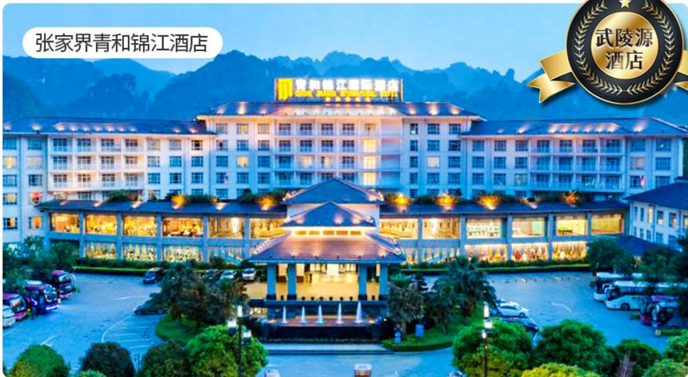
张家界青和锦江酒店