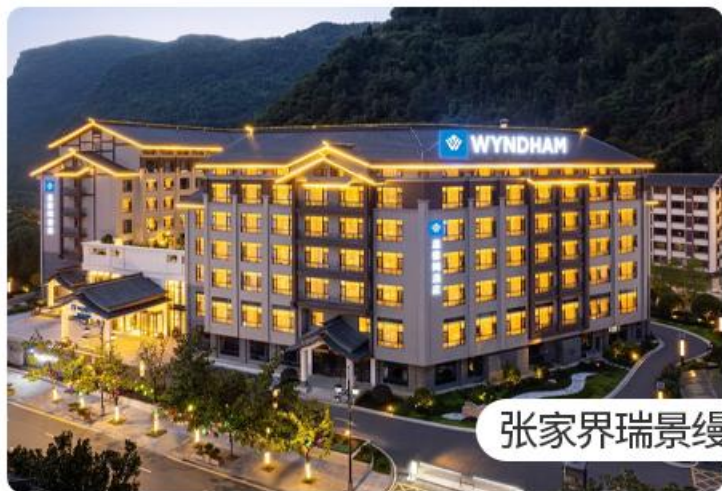
张家界瑞景缙山温德姆酒店