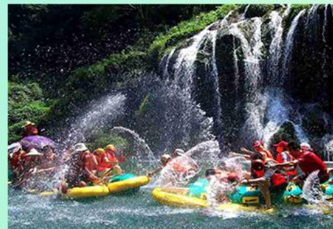
猛洞河漂流 MENG DONG HE PIAO LIU