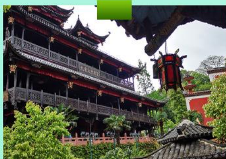
土司王府 QICHONGDENG GUANGXIU