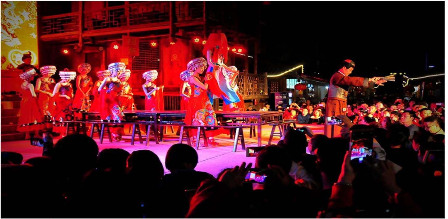
赠送超值民族歌舞大秀《赶场相亲》

Business accommodation Quasi-triple accommodation