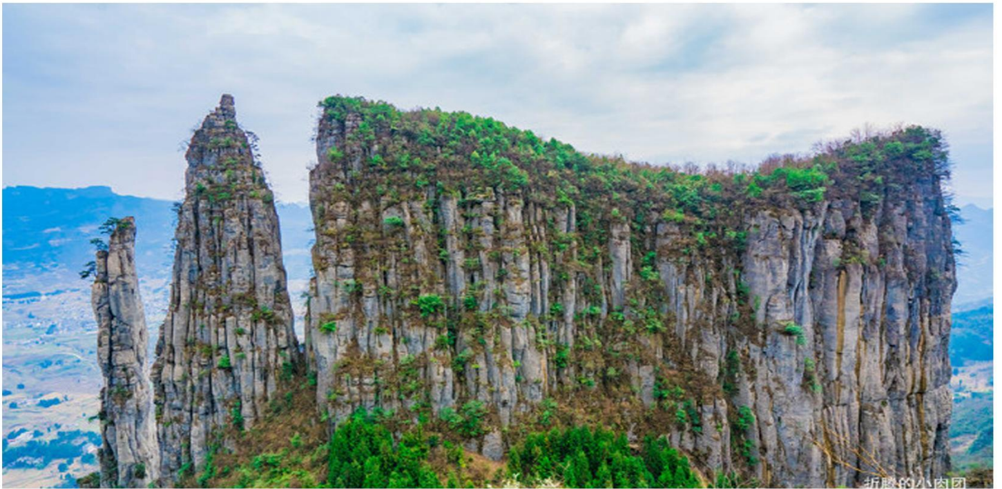
喀斯特地貌-5A恩施大峡谷

Essential scenic spot Internet celebrity Enshi