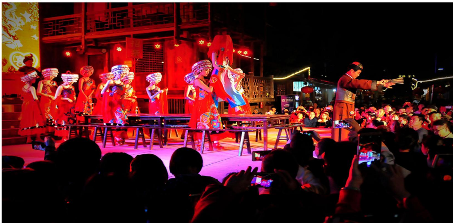
赠送超值民族歌舞大秀《赶场相亲》

Business accommodation Quasi-triple accommodation