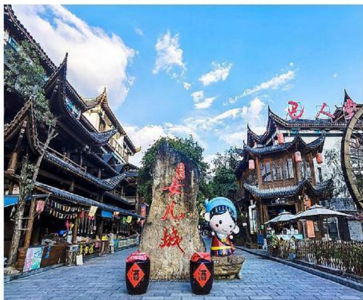
天下女儿不二心-女儿城