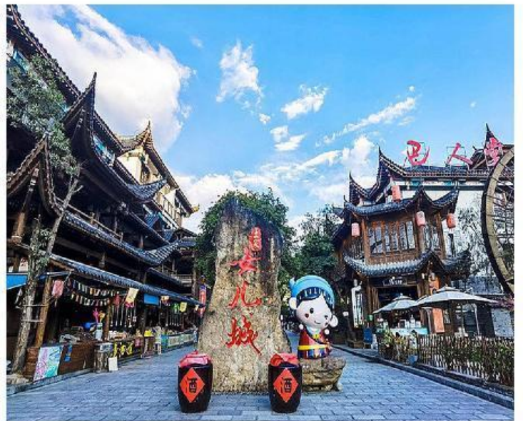
天下女儿不二心-女儿城