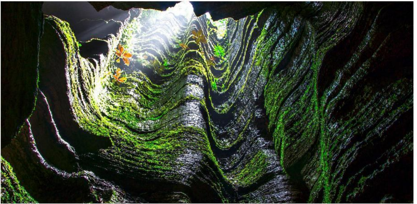
4.6亿年前的奥陶纪石林-梭布垭石林

Essential scenic spot Internet celebrity Enshi