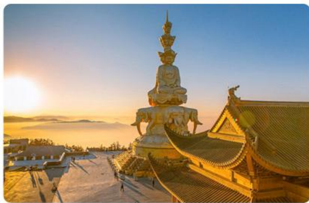
峨眉山 深度二进峨眉山