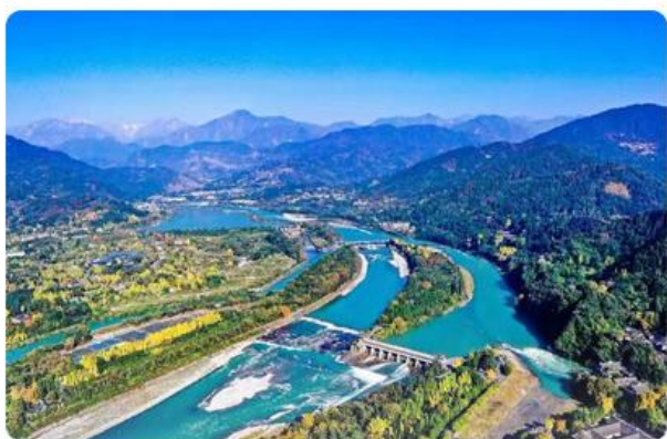
都江堰景区 千年水利工程