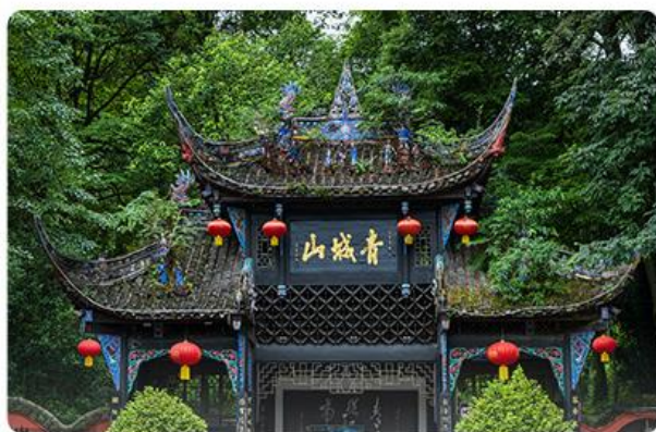
青城山景区 道教发祥地之一