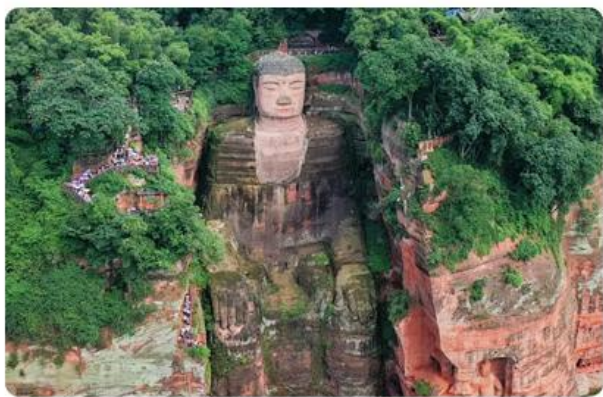
乐山大佛 世界最高座佛