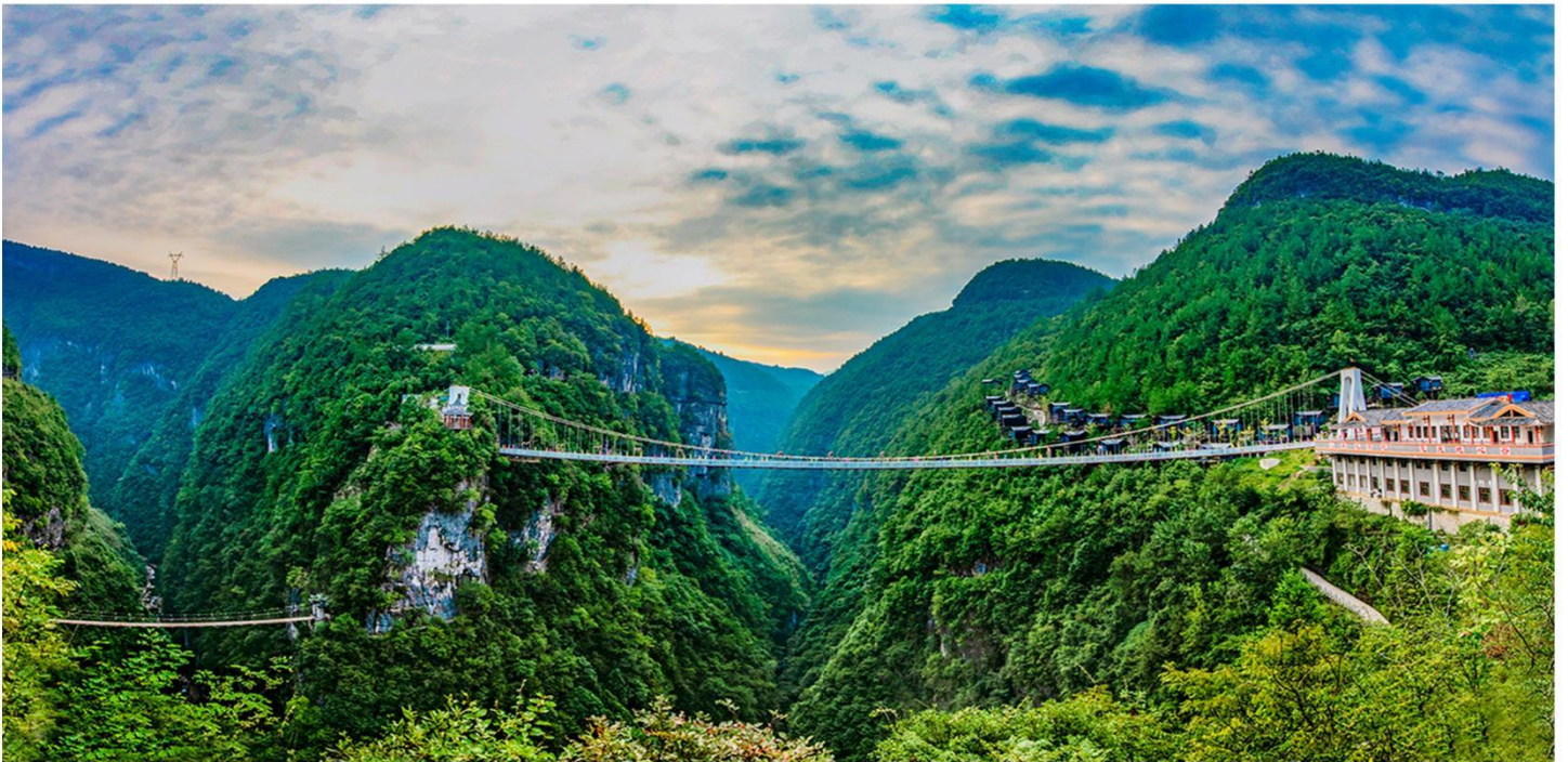
“施南第一佳要”-地心谷