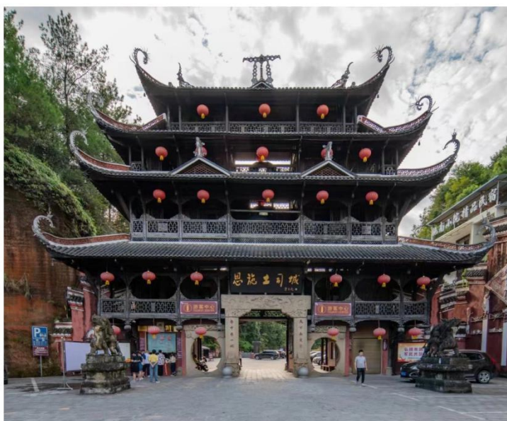
“中国土司王宫”土司城