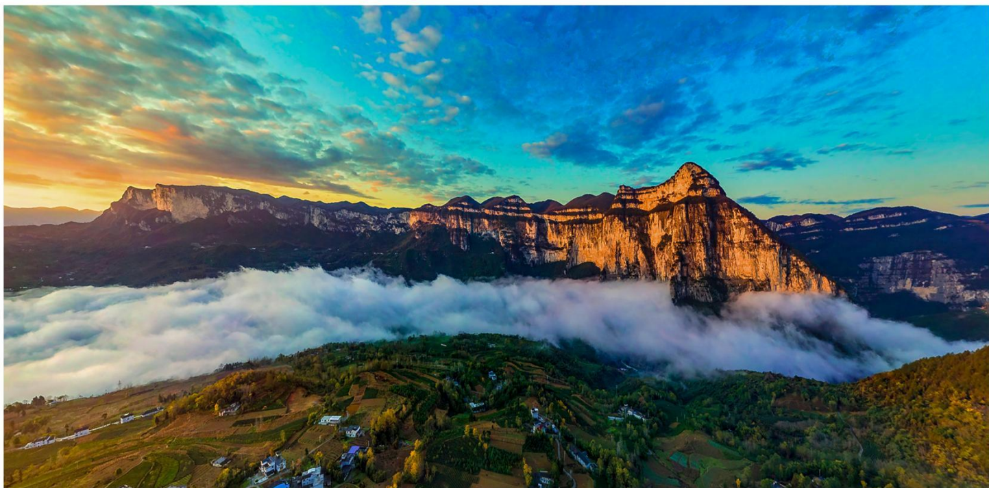
喀斯特地貌-5A恩施大峡谷