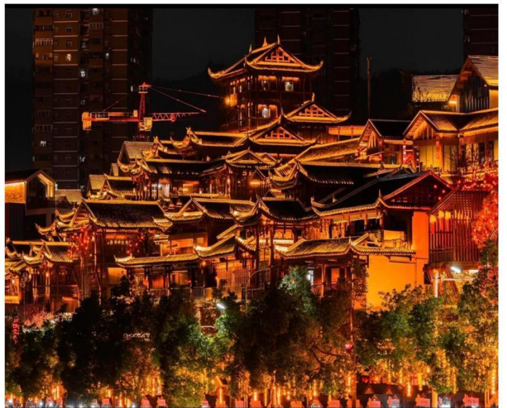
恩施洪崖洞-仙山贡水