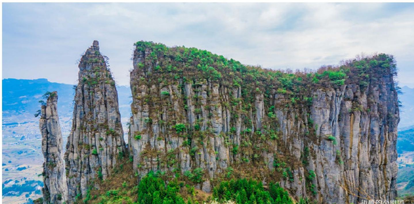
喀斯特地貌-5A恩施大峡谷

Essential scenic spot Internet celebrity Enshi