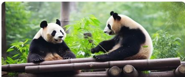
成都大熊猫基地 邂逅超萌国宝，多种角度 近距离观察