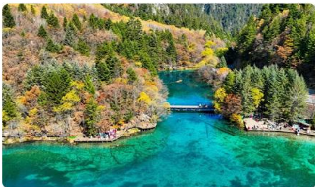
九寨沟 国家5A级景区 人间仙境九寨沟，此景难得几回报