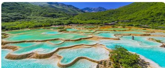
黄龙 国家5A级景区 此景只应天上有，人间何来黄龙池