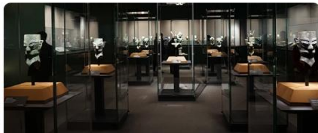
三星堆博物馆 打卡国家宝藏、探秘古蜀文明