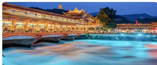
都江堰 深度游览千年水利工程