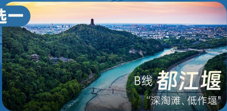
B线 都江堰 “深淘滩、低作堰”