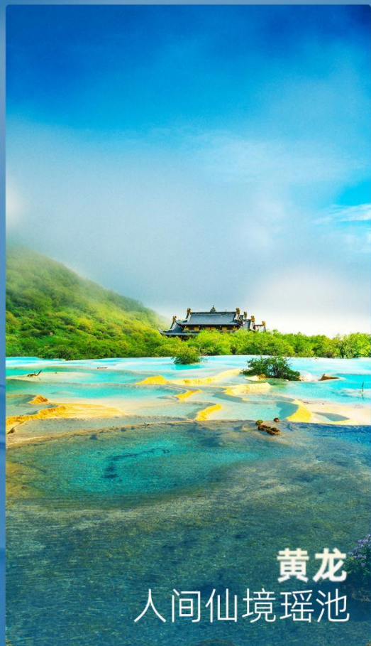
黄龙 人间仙境瑶池