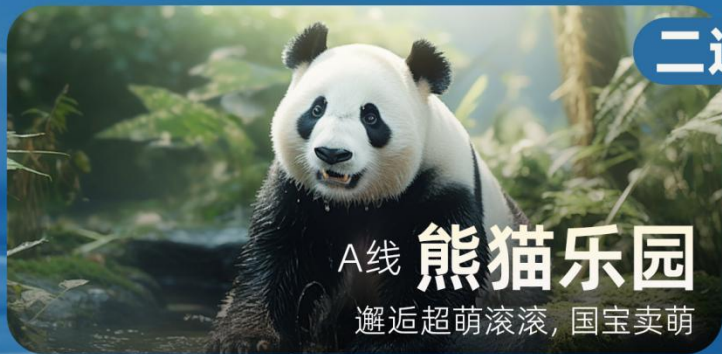
A线 熊猫乐园 邂逅超萌滚滚，国宝卖萌