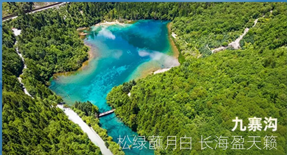
九寨沟 松绿蘸月白 长海盈天籁