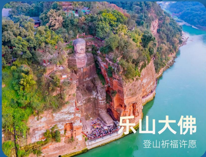
乐山大佛 登山祈福许愿