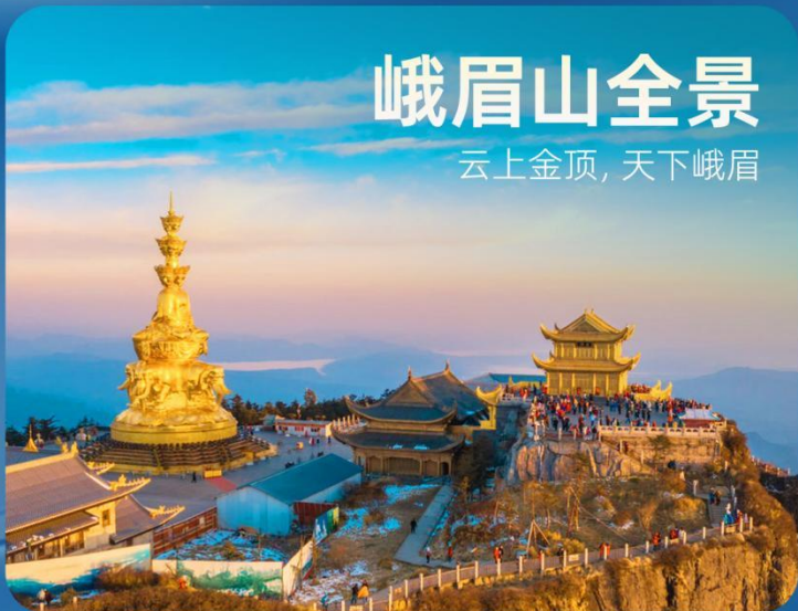
峨眉山全景 云上金顶，天下峨眉