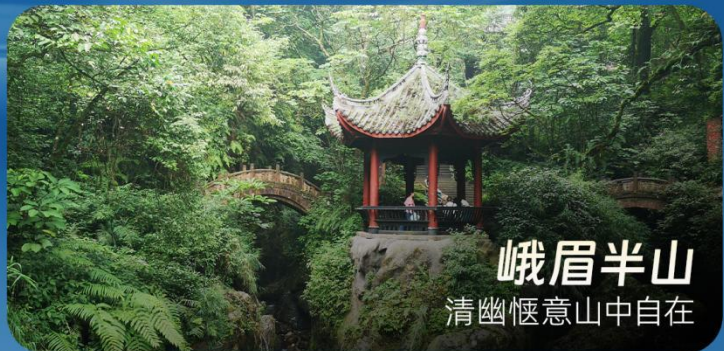
峨眉半山 清幽惬意山中自在