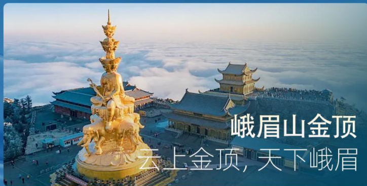
峨眉山金顶 云上金顶，天下峨眉