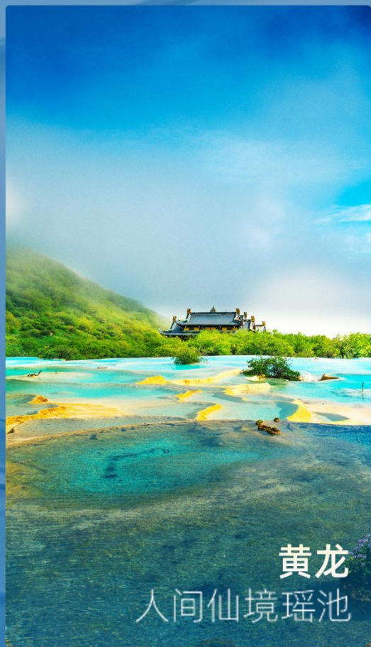
黄龙 人间仙境瑶池