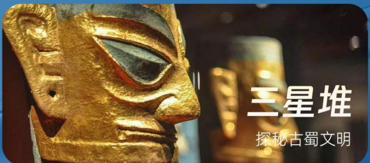
三星堆 探秘古蜀文明