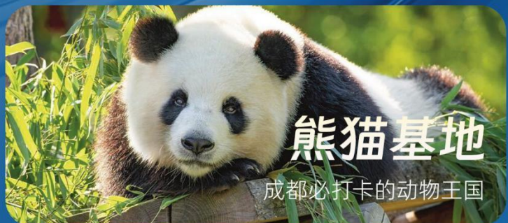
熊猫基地 成都必打卡的动物王国