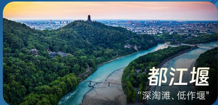
都江堰 “深淘滩、低作堰”