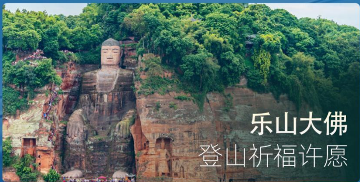
乐山大佛 登山祈福许愿