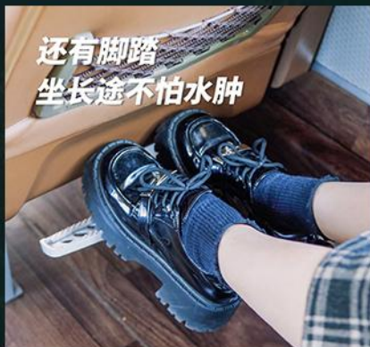
还有脚踏 坐长途不怕水肿