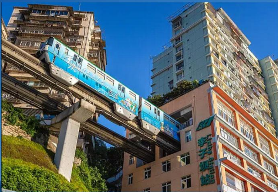
李子坝体验轻轨穿楼