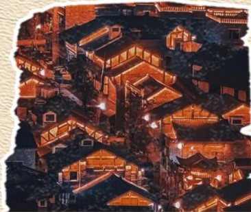
十八梯 一条有着悠久历史的石板阶梯街