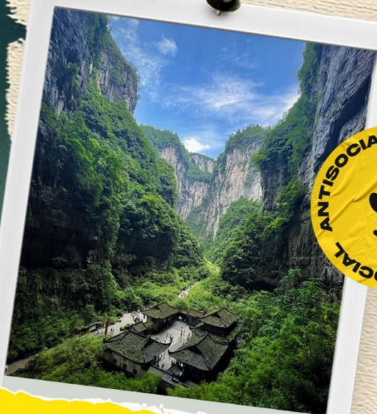
天生三桥 世界最高的天生桥群