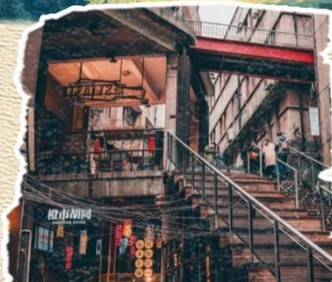
鹅岭二厂 一处融合文化、艺术和历史的独特景点