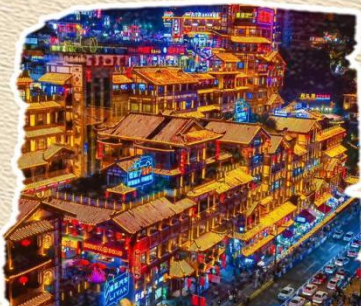
洪崖洞 人间千与千寻