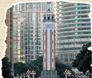
解放碑 /首批全国示范步行街 重庆人民的精神堡垒