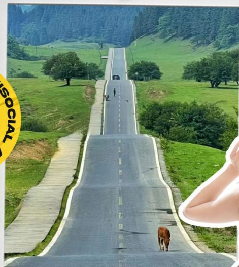
仙女山 南国第一牧原