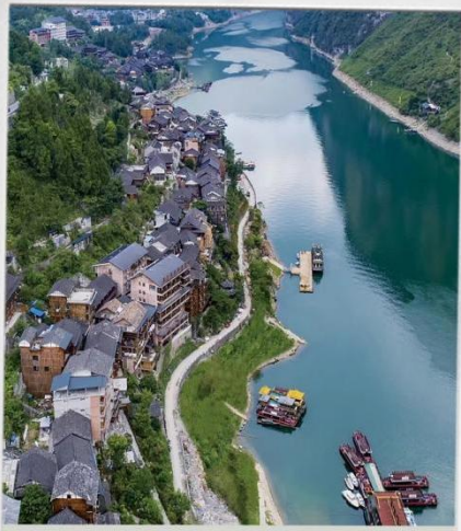
乌江画廊 千里乌江百里画廊