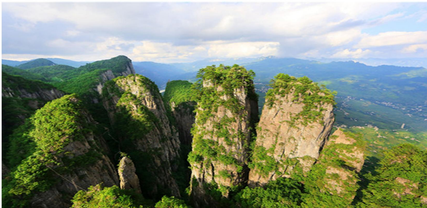
喀斯特地貌-5A恩施大峡谷

Essential scenic spot Internet celebrity Enshi