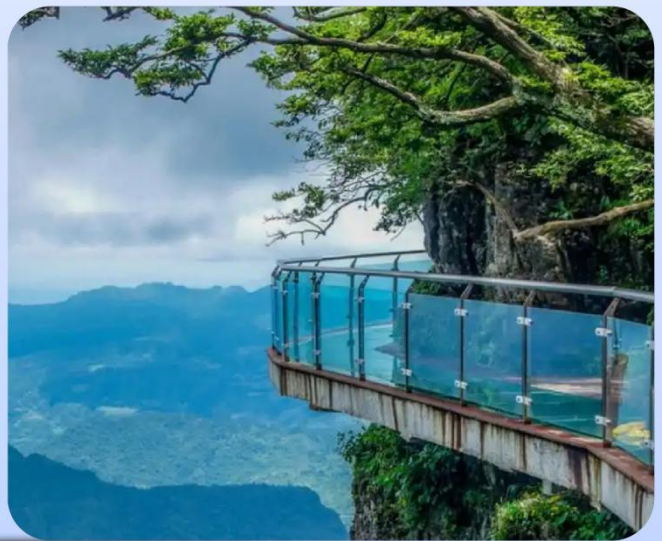
【天门山玻璃栈道】 垂直悬崖上的透明栈道