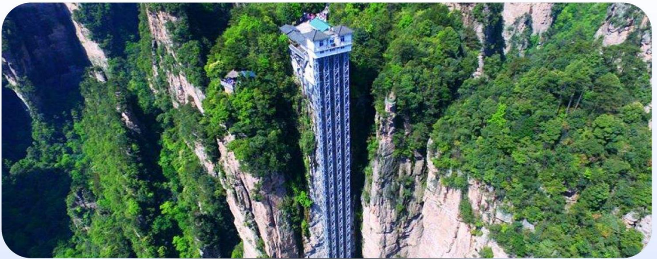
【百龙天梯】 世界最高户外第一梯