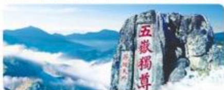
人民币背景5元观赏点