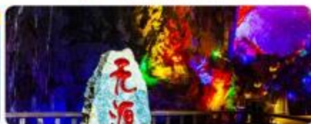
亚洲溶洞奇观无源洞