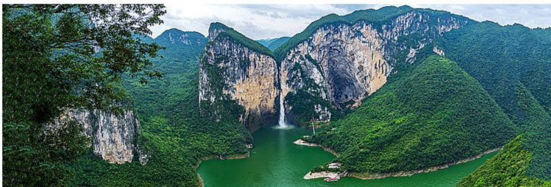
✓ 清江蝴蝶崖 Qingjianghudieya