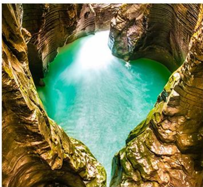
“地心谷” ◎建始直立人遗址