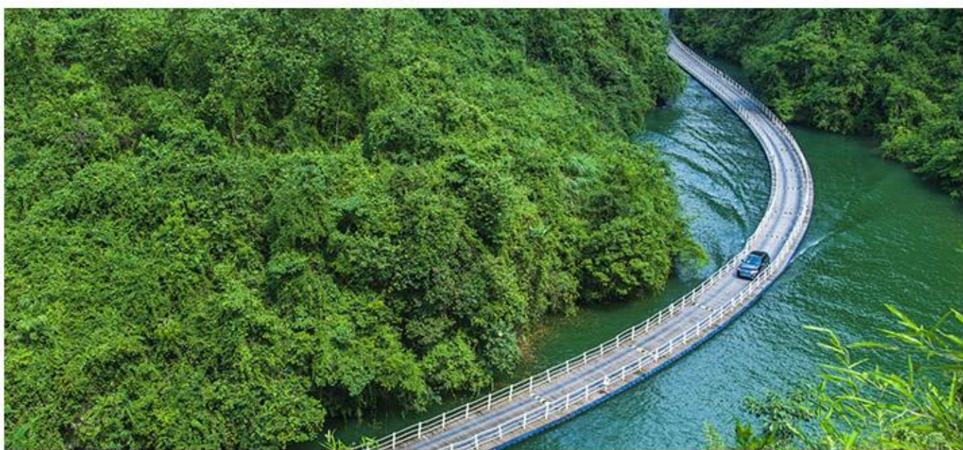
“狮子关” ◎廊桥遗梦◎醉美水上公路