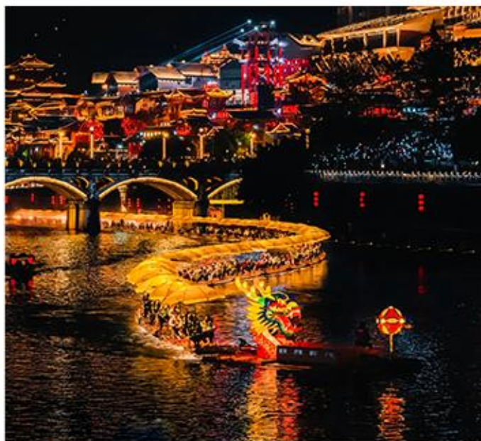
“仙山贡水” ◎醉美夜景