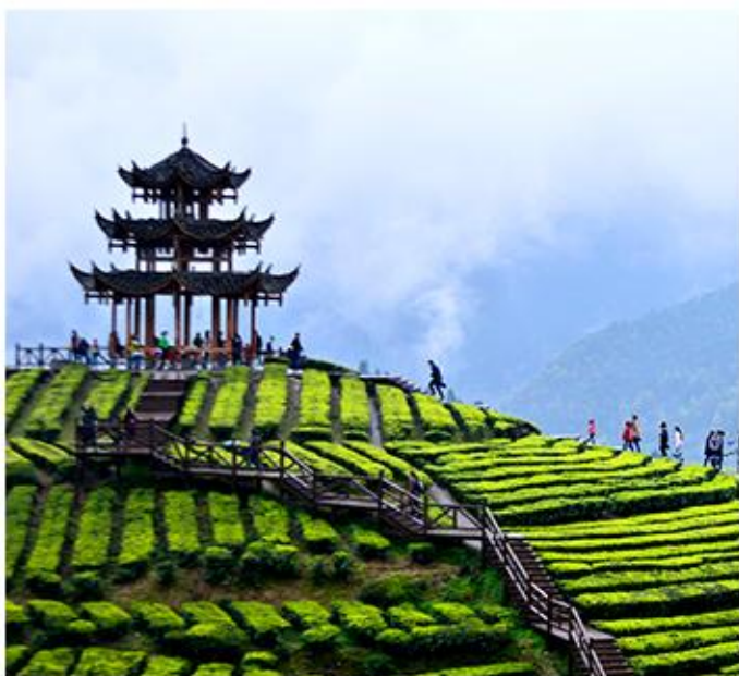
“伍家台” ◎自然生态茶乡仙境