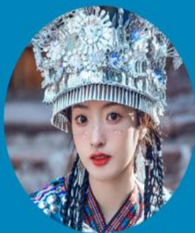
民族服装变装体验