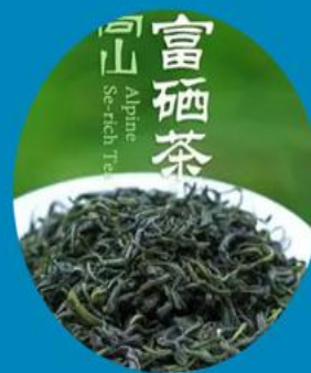
富硒茶叶每人一份