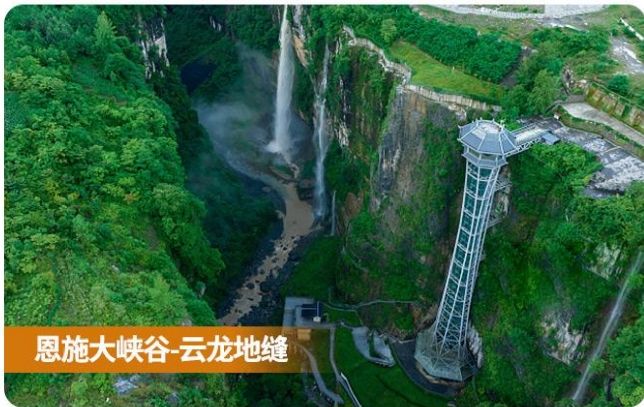
恩施大峡谷-云龙地缝