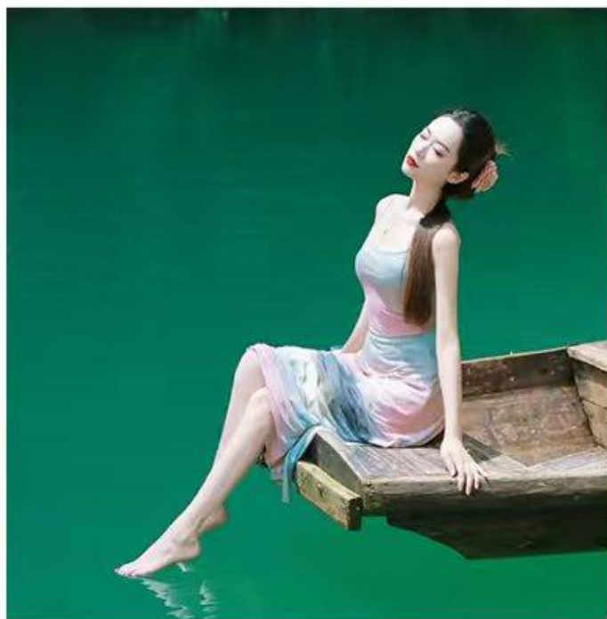
“屏山大峡谷”◎中国仙本那