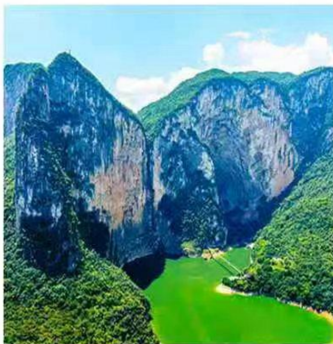
“清江大峡谷”◎蝴蝶崖