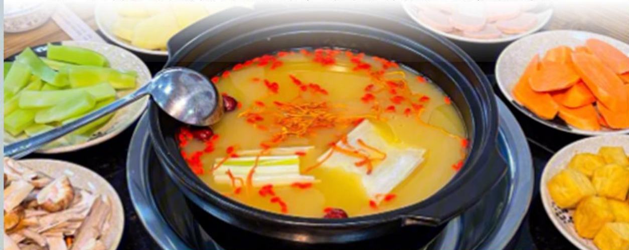
#浓汤藏味——特色牦牛汤锅

天水的酸辣鲜香直击味蕾，满是市井鲜活， 甘南的高原风味醇厚绵长，裹着草原纯粹。 每一口都是地域特色的浓缩，串联起舌尖上的陇原奇遇~