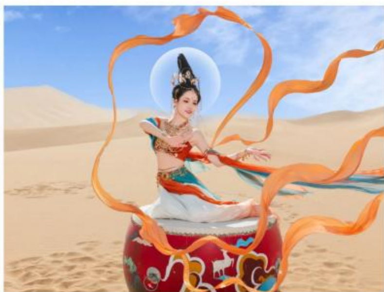
独家安排 独家安排1天的景区飞天旅拍