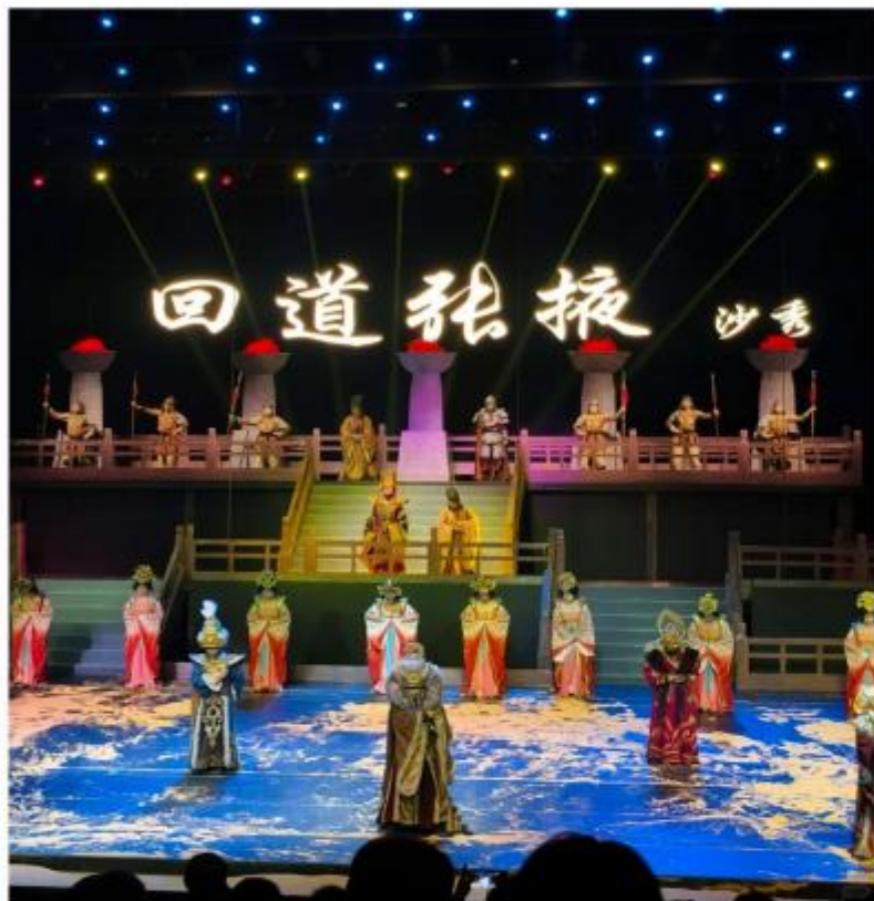
特别安排 价值280元的大型沙秀《回道张掖》