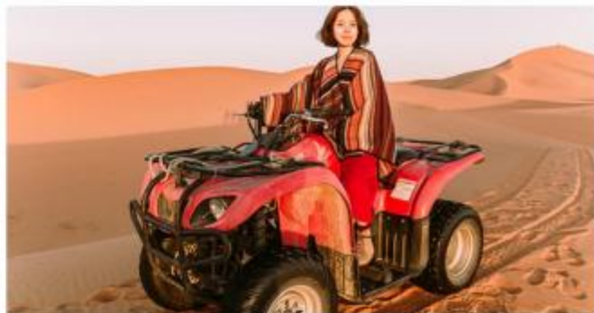
沙漠摩托车体验、惊险刺激沙漠滑沙