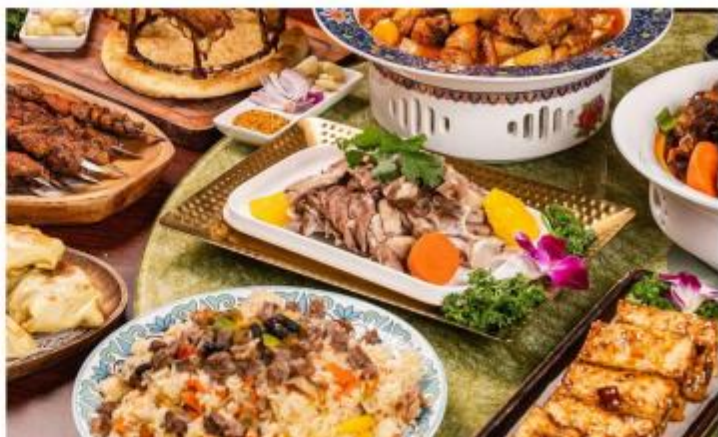
草原风味餐+特色小吃宴