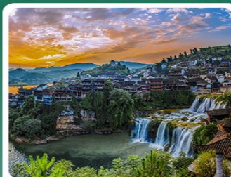
网红打卡凤凰古城