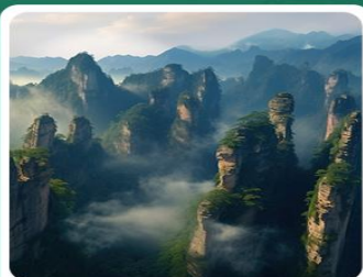
张家界国家森林公园