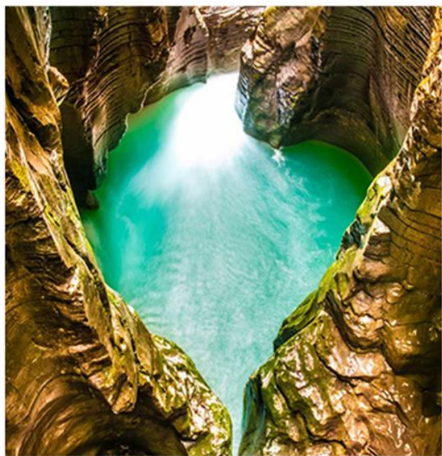
“地心谷” ◎建始直立人遗址