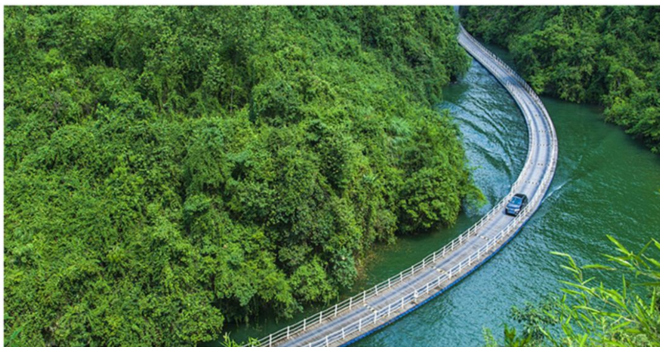
“狮子关” ◎廊桥遗梦◎醉美水上公路